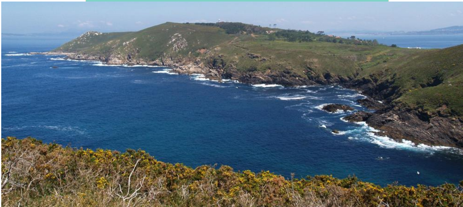
15-Punta de Liñeiro e enseada das Caniveliñas