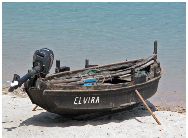
2-Praia das Dornas