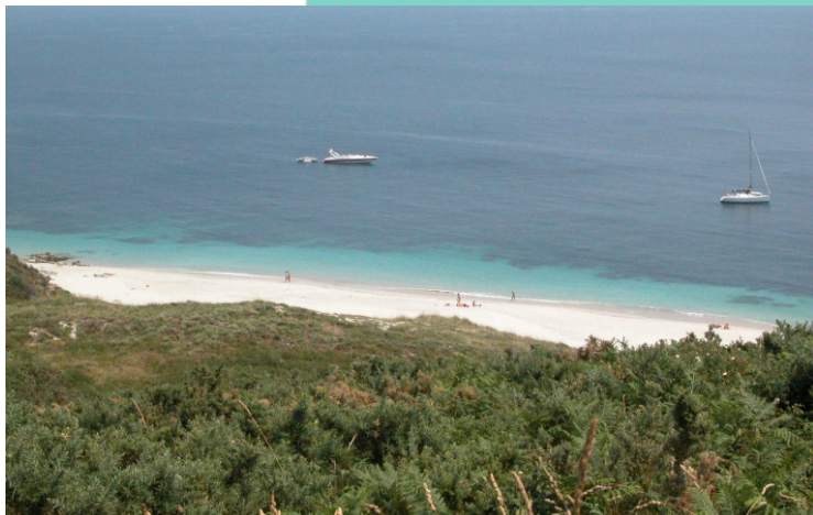
5-Praia de Melide, o mellor areal de Ons cun complexo dunar ben conservado.