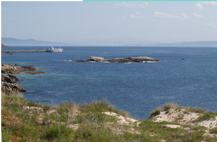
31-Punta da Figueira Brava e Laxe do Abade. Está catalogada como LIX: Plataforma de erosión mariña fósil de Figueira Brava. Situada lixeiramente por enriba do actual nivel do mar, é testemuña do que acadou durante o último interglaciar.

Laxe do Crego ou do Abade. Un enterramento medieval de forma antropomorfa escavado na rocha, fronte á punta da Figueira Brava. Pódese acceder coa marea baixa.