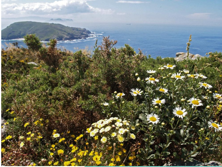
Vexetación nos cantís de Ons.

A maioría da superficie da Illa de Ons está ocupada por un denso mato de toxos xunto con anxélicas, xestas, queirugas, silvas, fentos, carpazas, troviscos, acedas, margaridas... Da vexetación arbórea orixinal so se conservan algúns salgueiros e estripos. Algunhas zonas están repoboadas con piñeiros e eucaliptos. Nos cantís hai herba de namorar, prixel do mar, fento mariño, colexas... e nas dunas feo, eiruga mariña, correola das praias, leiteira, alhelí, cebola das gaivotas... Nos fondos mariños e nas rochas hai unha grande diversidade de algas.