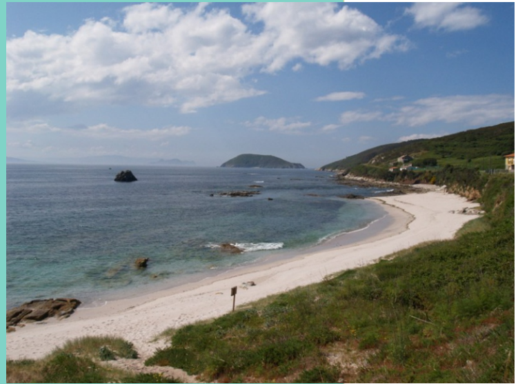
30-Praia de Canexol. Está catalogada como LIX (Lugar de Interese Xeolóxico). -Praia colgada, coluvións e derrubios de Canexol. Poden observarse secuencias de derrubios (periodos fríos, secos e con escasa cuberta vexetal) e coluvións (periodos máis húmidos), con materia.