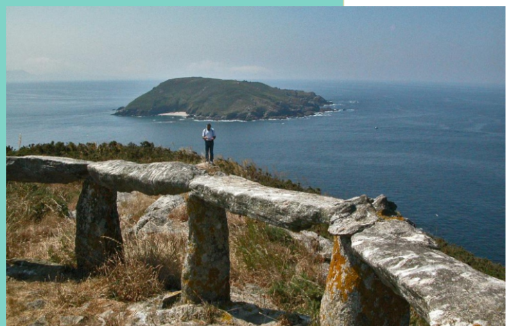
Mirador na punta de Fedorento