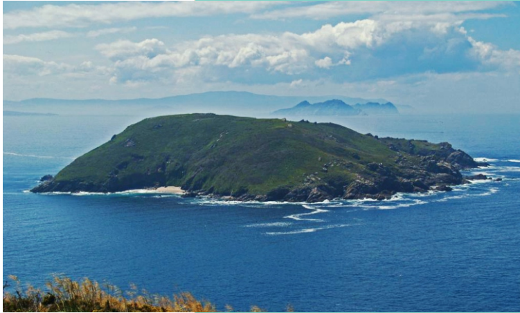
Illa de ONZA, coa praia das Moscas.