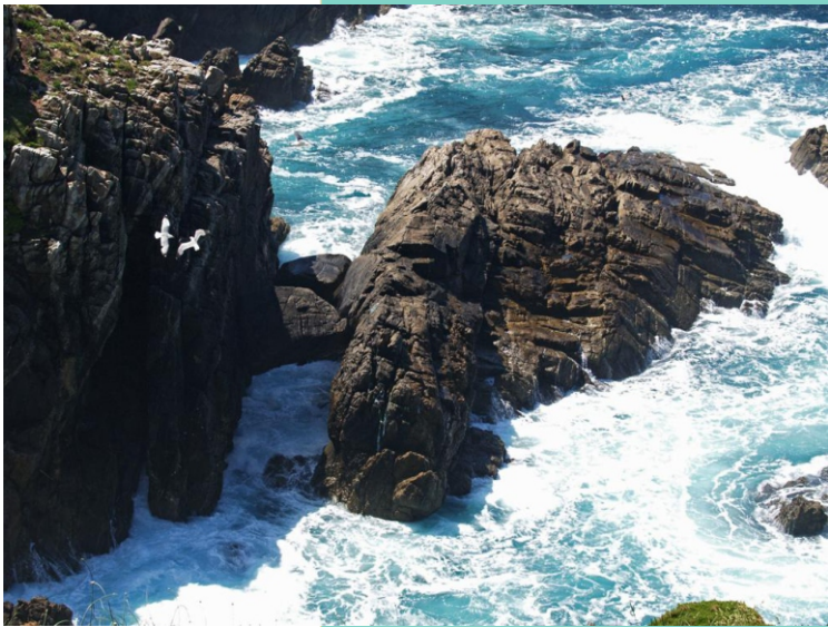
Cantís nas proximidades do Buraco do Inferno

Buraco do Inferno. Un conduto vertical de máis de 50 m de profundidade conectado co mar a través dunha curta galería. No interior hai algunhas formacións por depósitos minerais entre as que destaca o "leite de Lúa", constituído por silicatos en fases líquida e sólida. Segundo a tradición nel vivía o demo, xunto aos araos que cos seus berros infernais asustaban aos veciños.