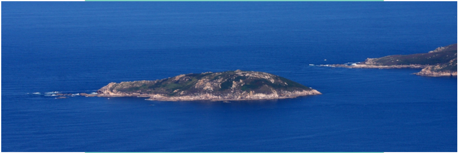
Vista a érea da illa de Onza e as puntas Punta da Porta e Fedorento