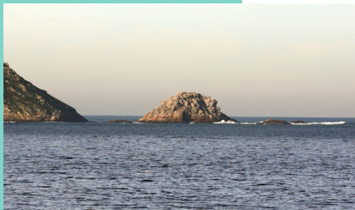
7-Punta e illote Centolo