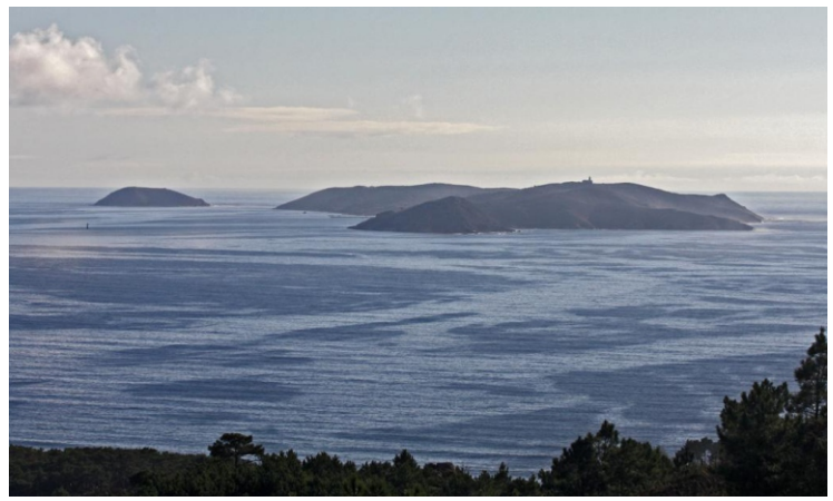
Ons desde o Monte da Siradella (O Grove).