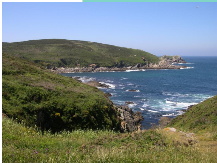
17-Punta das Xestas, enseada das Caniveliñas e O Morro