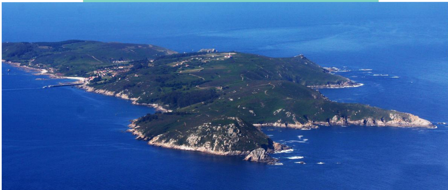
Vista aérea da cara sur de Ons: punta do Galiñeiro, Cova do Lobo, punta do Centolo, enseada da Pociña, punta Pasante ou Xuvenco, enseada Bastián de Val e punta Estripeiral.