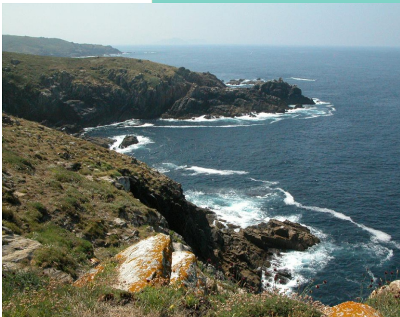
21-Punta Rabo da Égoa