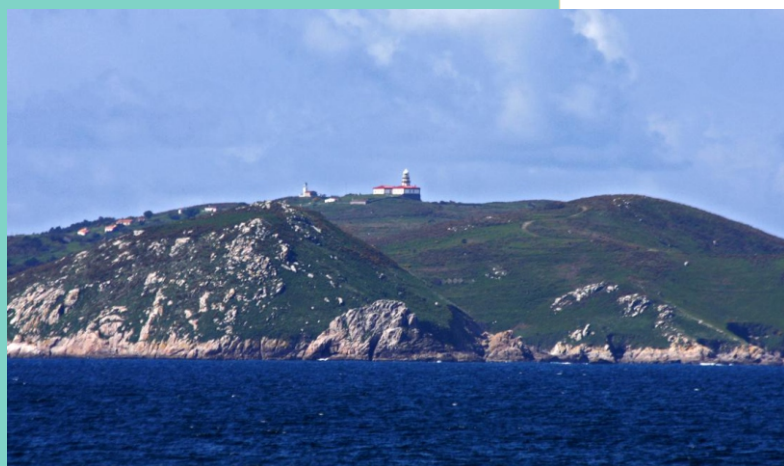
Faro de Ons